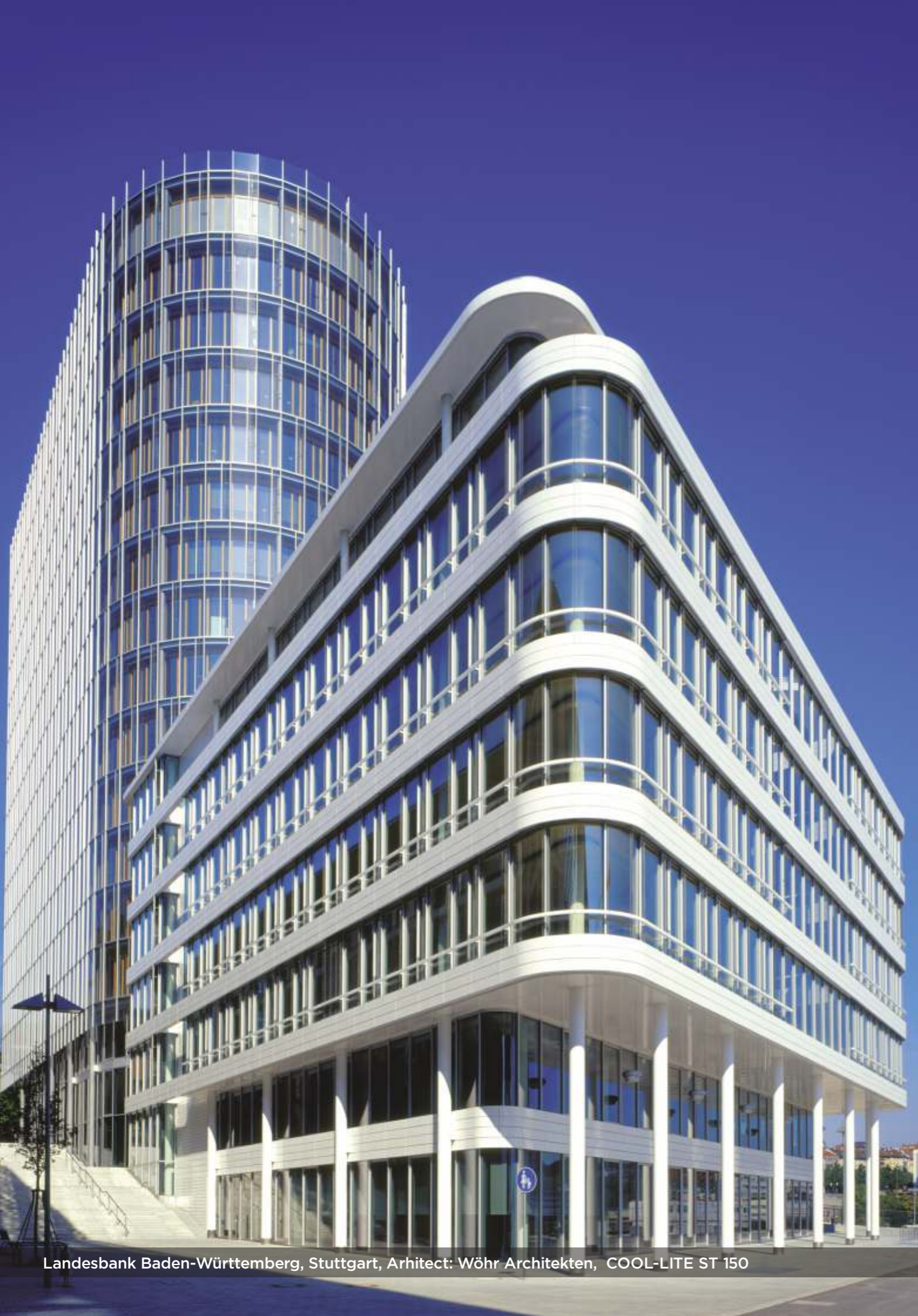
Landesbank Baden-Württemberg, Stuttgart, Arhitect: Wöhr Architekten, COOL-LITE ST 150