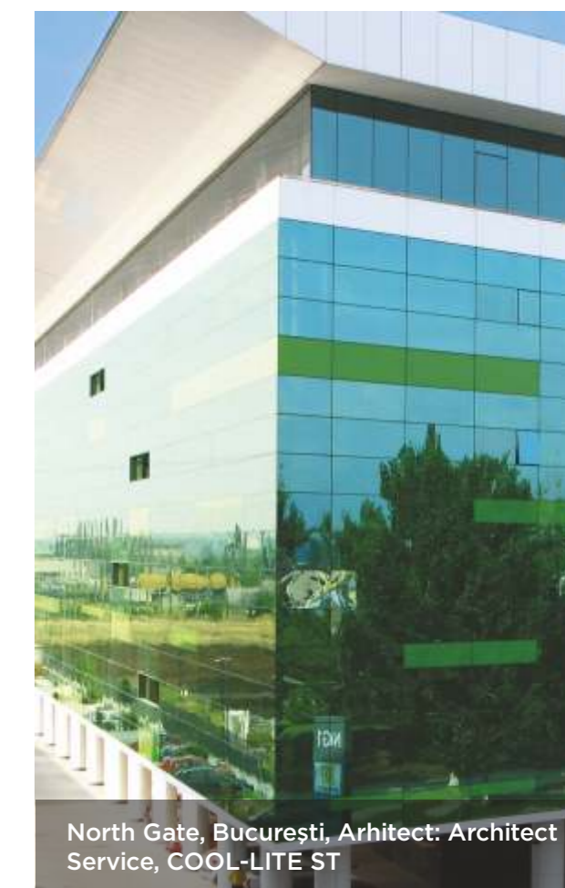
North Gate, București, Arhitect: Architect Service, COOL-LITE ST