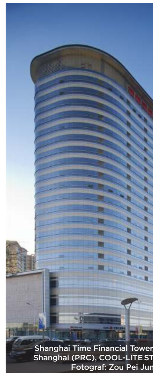
Shanghai Time Financial Tower, Shanghai (PRC), COOL-LITE ST