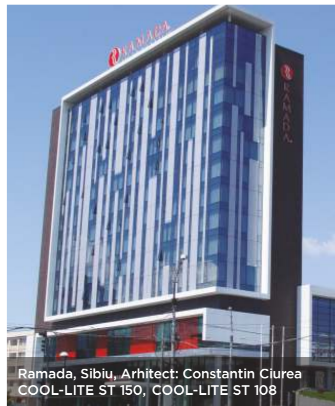
Ramada, Sibiu, Arhitect: Constantin Ciurea COOL-LITE ST 150, COOL-LITE ST 108

Procedeul de fabricație și tipul de material pulverizat conferă rezistență și durabilitate sporită acestui strat. Datorită acestor proprietăți, sticlele COOL-LITE® ST pot fi prelucrate (călitate, laminate, emailate etc.) fără să fie afectate caracteristicile tehnice și estetice. Se montează cu depunerea poziționată pe fața 2.