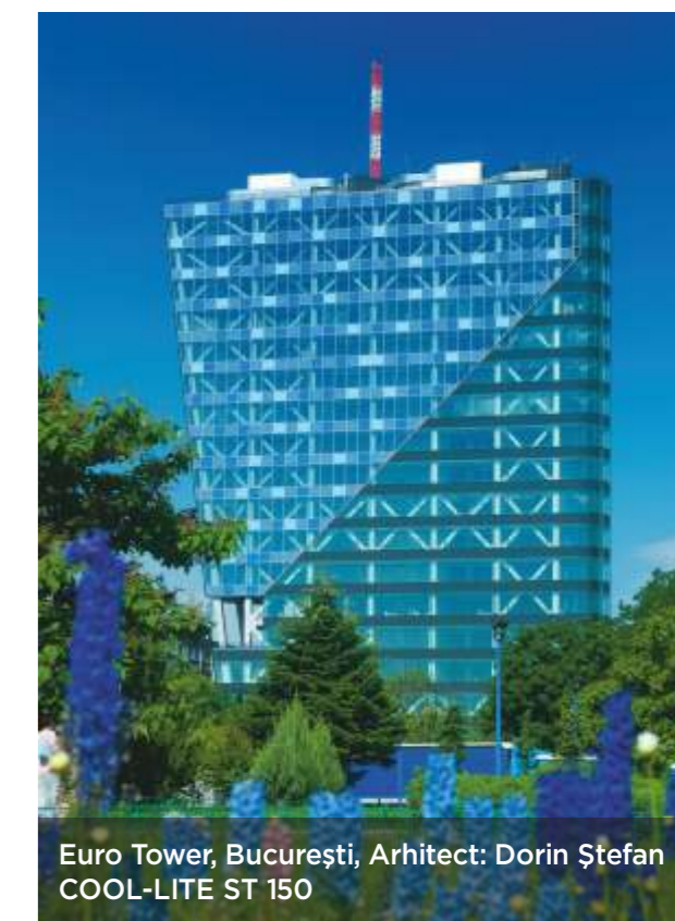
Euro Tower, București, Arhitect: Dorin Ștefan COOL-LITE ST 150

Adezivii folosiți pentru asamblarea în dublu vitraj sau pentru montajul structural trebuie să fie compatibili cu depunerea COOL-LITE® ST.