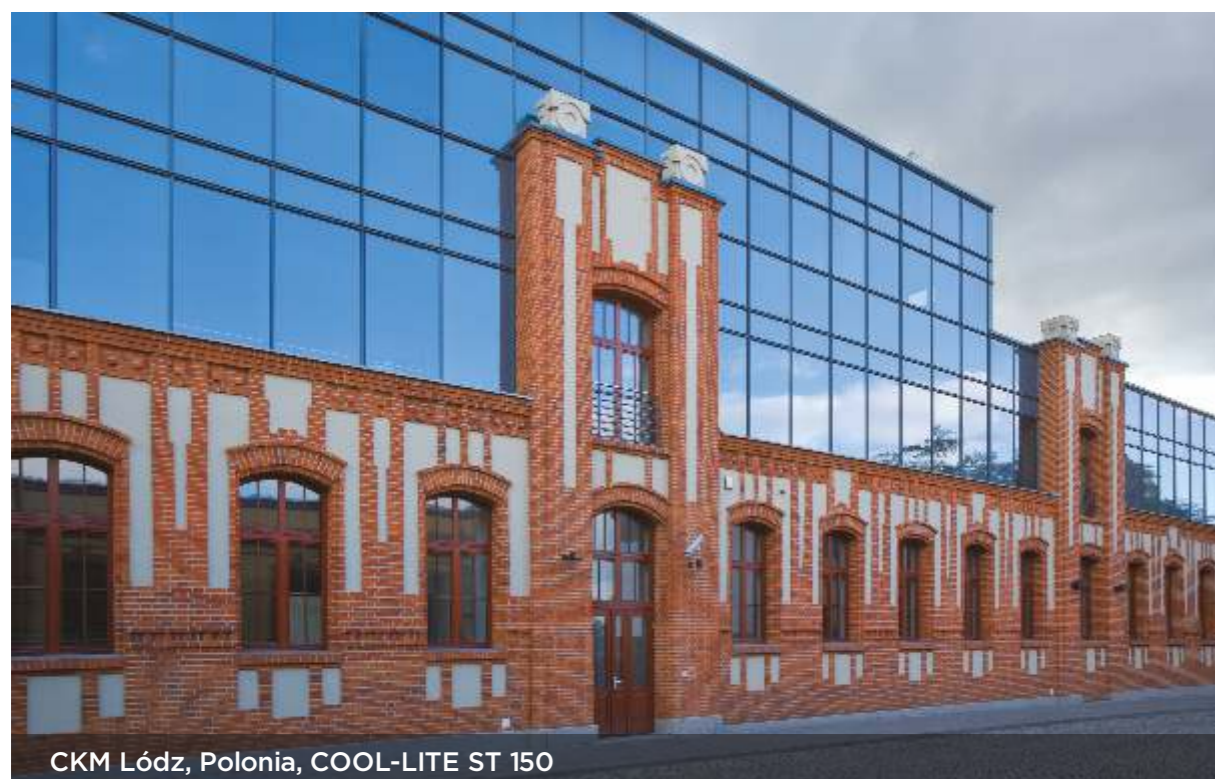
CKM Łódź, Polonia, COOL-LITE ST 150