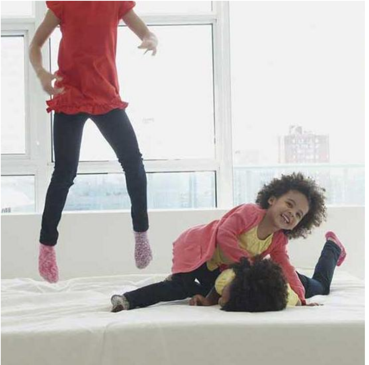
SGG STADIP SILENCE