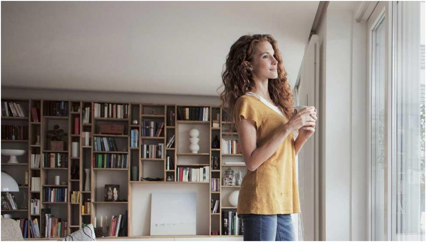
Il vetro quattro stagioni per le finestre